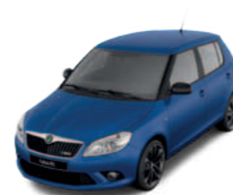
Race Blue (синий, металлик)