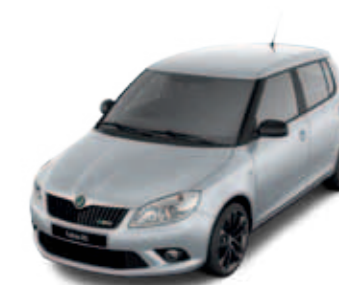
Brilliant Silver (серебристый, металлик)