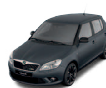
Anthracite Grey (серый, металлик)