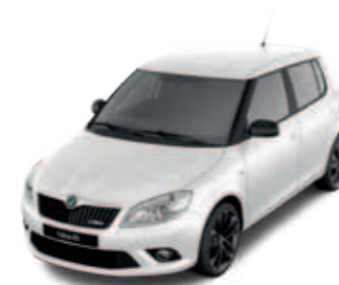
Candy White (белый)