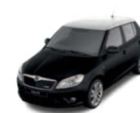
Крыша серебристого цвета