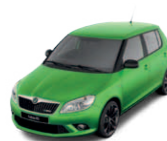
Rallye Green (зеленый, металлик)