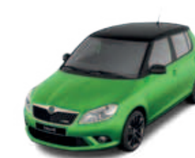
Крыша черного цвета