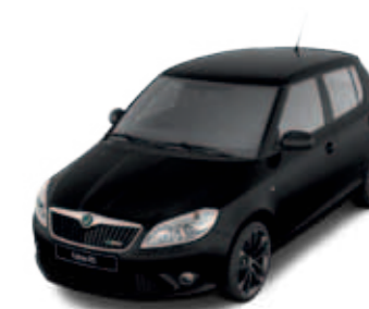
Black Magic (черный, перламутровый)