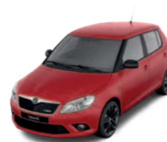
Corrida Red (красный)