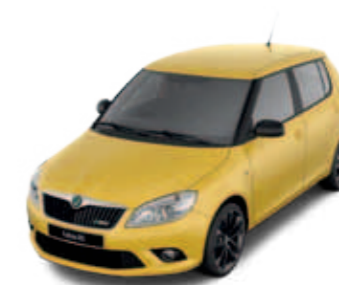
Sprint Yellow (желтый)